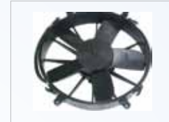
Figura 6. Abanico

Abanico: Elemento mecánico circular que mueve el flujo del aire a través del condensador y/o evaporador (Figura 6).