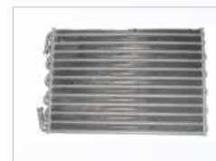
Figura 2. Condensador

Condensador: Intercambiador de calor (radiador) que elimina el calor en el refrigerante, en estado gaseoso, proveniente del compresor, convirtiéndolo en una mezcla (líquido y gas) y eliminando el calor removido del espacio acondicionado, por lo que éste se ubica en el exterior del recinto (Figura 2). En el Diagrama 1 se puede apreciar la ubicación del evaporador en el ciclo del sistema acondicionador de aire.