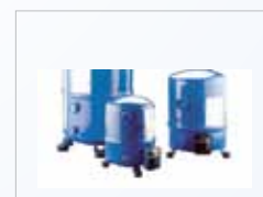
Figura 3. Compresor

Compresor: Equipo mecánico que comprime el refrigerante en forma de vapor, incrementando así su presión y temperatura, para posteriormente ser transportado por la tubería en forma de gas caliente hasta el condensador. El compresor, en este caso, es accionado por un motor eléctrico (Figura 3).