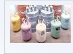
Figura 5. Refrigerantes

Refrigerante: Es un fluido que actúa como el agente de enfriamiento, con propiedades especiales para alcanzar los puntos de evaporación y condensación. Mediante cambios de presión y temperatura, éste absorbe calor de un espacio y lo disipa en otro. En el mercado existen diversos tipos, dependiendo del uso deseado (Figura 5).