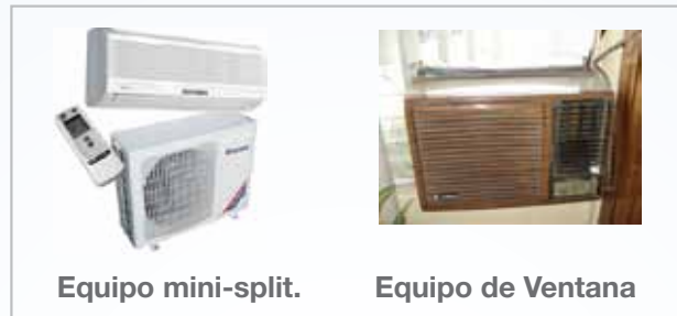
Figura 1. Equipos acondicionadores de aire

Un equipo acondicionador de aire retira calor de un recinto según las condiciones de comodidad térmica deseadas, a través del empleo de un fluido de trabajo denominado refrigerante. En la Figura 1 se presenta un equipo acondicionador de aire tipo mini-split.