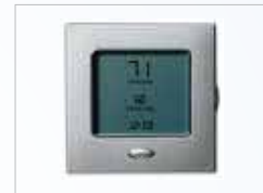
Figura 7. Termóstato

Termostato: Es un dispositivo cuya función es apagar o encender automáticamente el sistema acondicionador de aire, a fin de mantener el área climatizada o acondicionada dentro de un rango de temperatura deseado por el usuario (Figura 7).